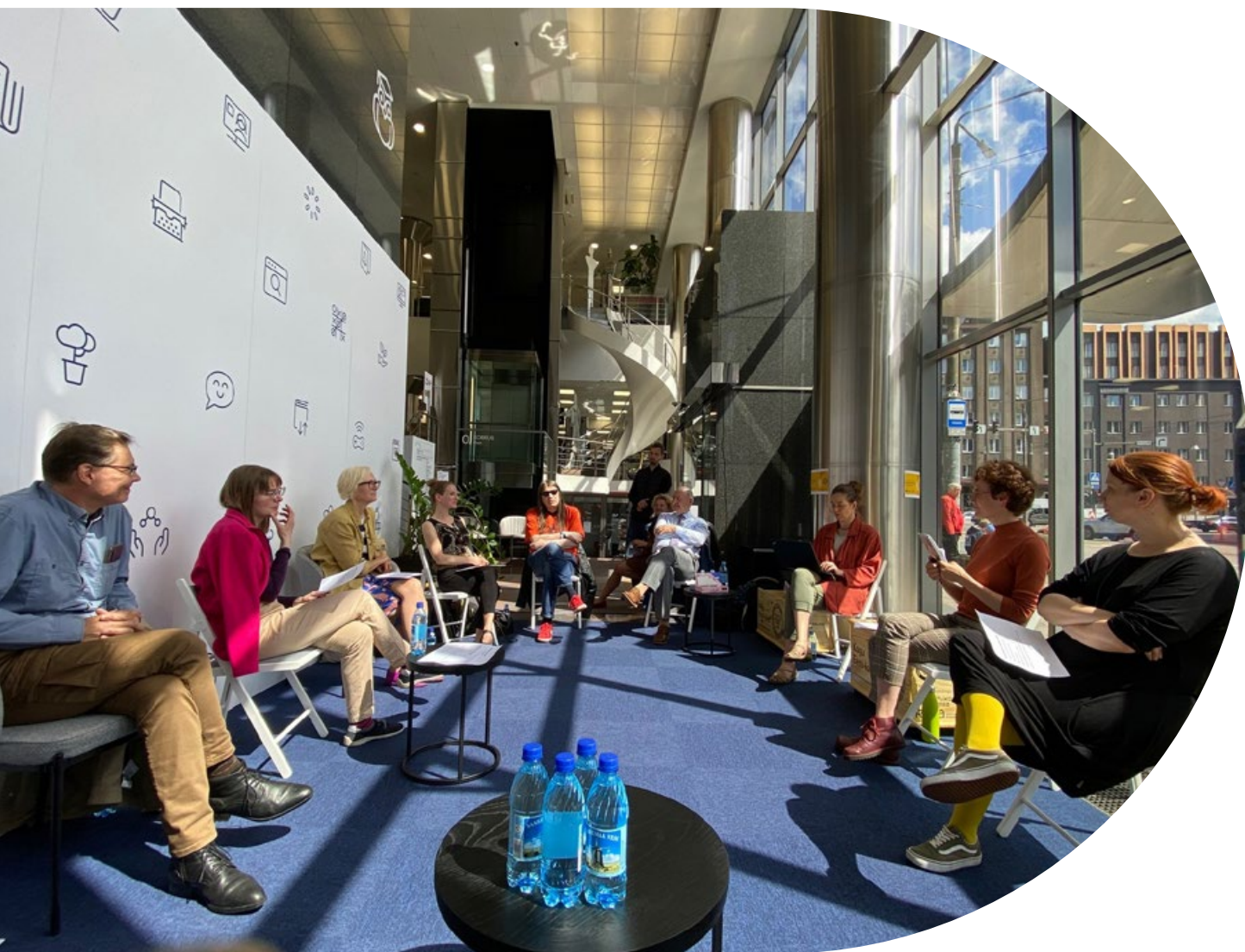
Sündmustesari „Dialogiring“.