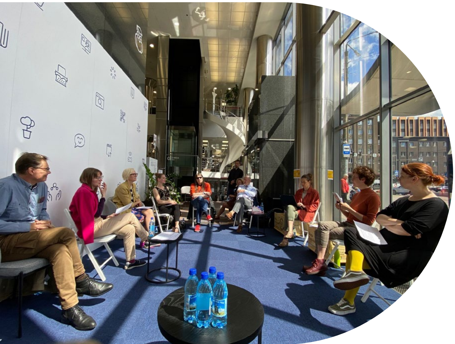
Sündmustesari „Dialogiring“.