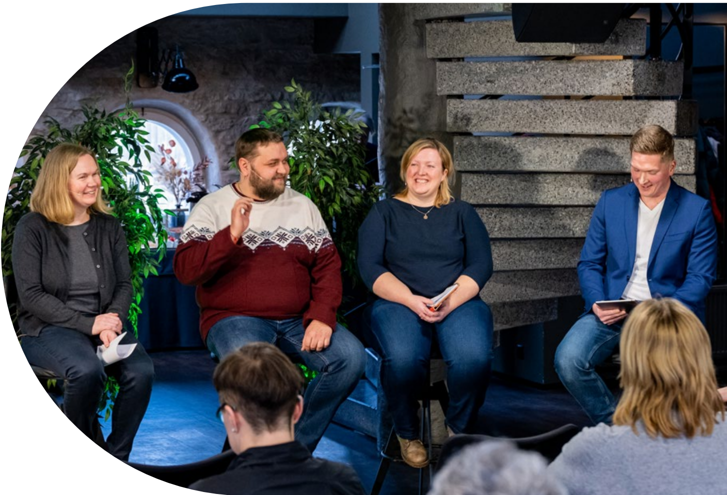
Rahvaalgatus.ee inspiratsioonipäev „KOV: kohaliku osaluse võimalused“ vol 2.

Eraldi tuleks välja tuua avaandmete mõju Riigikogu komisjonide tööle ning üldsusele laiemalt. Tänu avaandmetele on pöördumiste menetlusprotsess vahetult jälgitav suurele auditoriumile, see on nüginud vastuskirjade vormistust tavainimesele arusaadavamaks ning mugavalt kättesaadavaks.