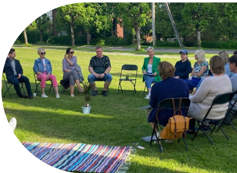
Kohalike dialoog kohalikus raamatukogus. Türi raamatukogu.

Mõjuna saame käsitleda ka Viljandi Linna raamatukogu (osales koolitusprogrammis 2022. aastal) ja kodanikuühenduse Loov Viljandi poolt käivitatud uut ühist kogukondlikku sündmussarja „Viljandi dialoogiring“. Dialoogikorraldamise oskused on andnud kohalikele raamatukogule uue rolli: olla sisuline partner kogukonnaühendusele, pakuda neutraalset füüsilist ruumi dialoogide pidamiseks, olla ühendaja.