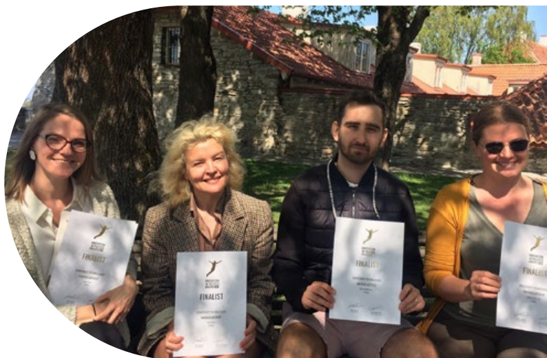
Rahvaalgatus.ee tõi The Innovation in Politics Awards 2023 nominatsiooni Eestisse. Fotol: Eesti Koostöö Kogu kontor